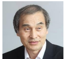
パネラー 高田祥三 早稲田大学名誉教授