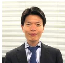
招待講演 内野泰明 経済産業省 産業技術環境局 企画官